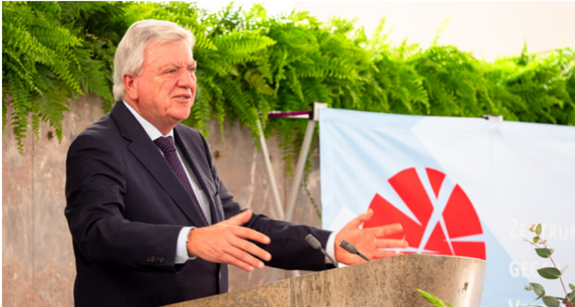
Der Hessische Ministerpräsident und Schirmherr Volker Bouffier.

Generation. Sie stehen als Vorbilder für mich, weil sie ein Land mit aufgebaut haben, das beispielhaft ist, um das uns in dieser Welt so viele beneiden. Ich frage gelegentlich: „In welchem Land willst du eigentlich leben?“, bei diesen ständigen Kritikastern, den ständigen Moll Diskussionen über Deutschland. Und ich sage denen: „Nicht als Urlauber, sondern wo möchtest du leben?“ Da kommt fast immer: „In Deutschland“. Meine Damen und Herren, warum sage ich das? Diejenigen Menschen, die ihre Heimat verloren haben, die hier wieder neu angefangen haben, sind ein herausragender Teil unseres Landes. Das Land Hessen hat – je nachdem wie man es einschätzt – zwischen einem Viertel und 30 Prozent Menschen, die als Vertriebene zu uns gekommen sind. Dieses Land wäre heute nicht das Land, was es ist, ohne die Leistung der Menschen, die zu uns gekommen sind. Sie wurden damals nicht gerade freundlich aufge-