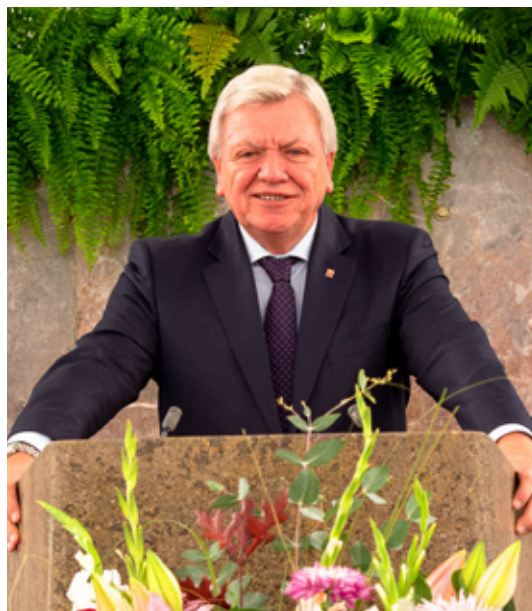
Der Hessische Ministerpräsident Volker Bouffier bei seinem Grußwort.

Das Leben für die Donauschwaben in Jugo- slawien war beendet, als im Oktober 1944 die Rote Armee auf der anderen Seite der Donau stand. Ich habe zwei Onkel, sie sind beide ver- storben. Ich habe mich oft mit ihnen unterhal- ten. Der eine studierte damals in Deutschland,