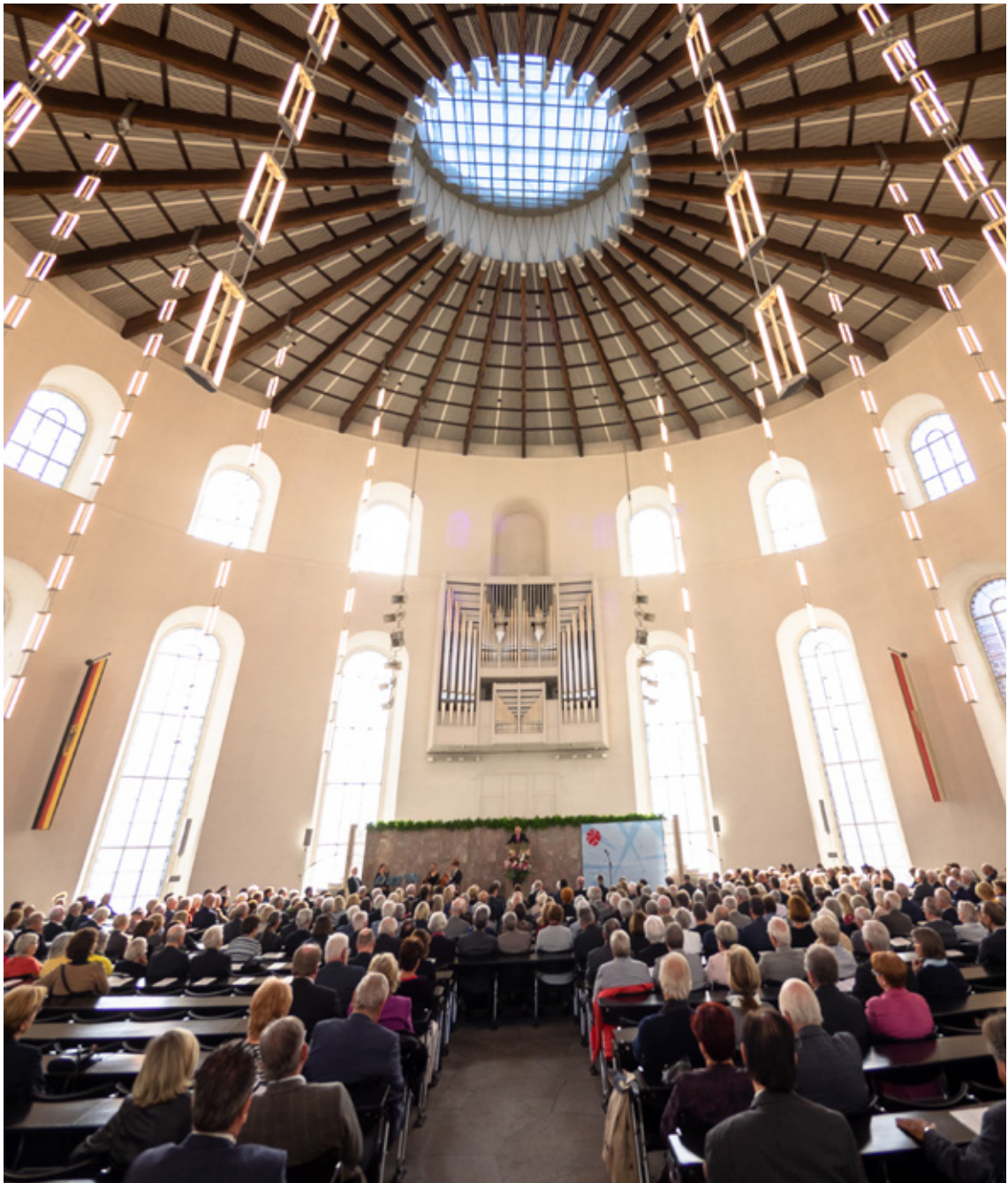
Blick in das Rund der Paulskirche.