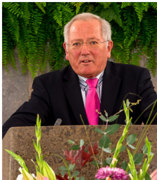
Dr. Christean Wagner, Vorsitzender der Stiftung ZENTRUM GEGEN VERTREIBUNGEN.

Sehr geehrter Herr Ministerpräsident Bouffier, Sie haben traditionsgemäß die Schirmherrschaft übernommen, wie seit vielen, vielen Jahren. Dafür sind wir Ihnen sehr dankbar. Denn das ist kein formaler Akt, das ist auch ein Bekenntnis Ihrerseits zu den Aufgaben und Zielen unserer Stiftung. Noch dankbarer sind wir Ihnen, dass Sie heute zu uns sprechen. Das ist