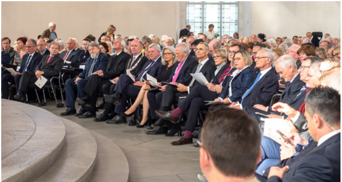
Bis auf den letzten Platz gefüllt war die Paulskirche zur Preisverleihung.