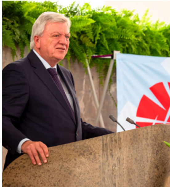
„Heimat ist ein unveräußerliches Recht. Heimat bleibt.“ Ministerpräsident Volker Bouffier während seines Grußwortes zur Preisverleihung.