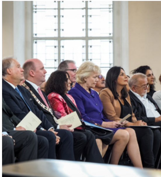
Gespannte Erwartung in der ersten Reihe.

Freya Klier hat mit dieser Arbeit aber auch ein weiteres Thema enttabuisiert: Die Vergewaltigung von Frauen als Kriegsmittel. Dieses grausame Vorgehen gibt es, seitdem es Kriege gibt und wurde von zu vielen Kriegsparteien angewendet. So wurden auch deutsche Frauen in Kriegsgefangenschaft systematisch vergewaltigt. Sie tauchten in der Nachkriegspolitik aber nicht auf, waren gar ein Tabuthema. An dieser Stelle möchte – oder eher muss ich – die letzte