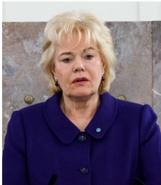
Erika Steinbach MdB, Vorsitzende der Stiftung ZENTRUM GEGEN VERTREIBUNGEN.

Mit dem Fall des Eisernen Vorhangs gab es vielfach die fast euphorische Hoffnung auf eine bessere, eine friedlichere Welt. Erfüllt haben sich diese Hoffnungen höchstens partiell. Sollen wir resignieren, weil erkennbar ist, dass der Mensch zu jedweder Brutalität fähig ist? Nein, und nochmals nein! Das wäre eine Kapitulation vor dem Bösen! Wir müssen immer und