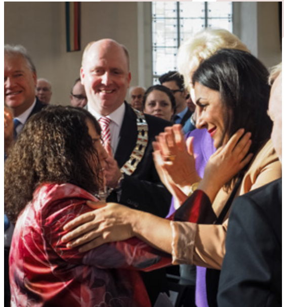
Umarmung von Preisträgerin und Laudatorin.

Der Abschluss-Bericht stammte aus dem Jahr 1952: Es war das Jahr, in dem die meisten der weit mehr als 500 sowjetischen Arbeitslager geschlossen wurden und alle Akten nach Moskau befohlen wurden. Es ist mir ein Bedürfnis, an dieser Stelle dem mir unbekanntem Moskauer Archivar zu danken. Danken möchte ich auch jenen Bewohnern West-Sibiriens, die mich bei meiner sich nun anschließenden Recherche-Reise ins Kohlebecken von Stalinsk unterstützten. Ich brauchte vor Ort eine Weile, bis ich mich zurecht fand. Bis ich begriff, dass ich mich in einem riesigen, multikulturellen Verbannungsgebiet befand. Die meisten Menschen hier waren selbst einmal Verbannte gewesen und einfach dort geblieben, vielleicht, weil sie keine Heimat mehr hatten. Viele arbeiteten danach weiter im Schacht, nun als Freie. Doch sind sie menschenwürdiger behan-