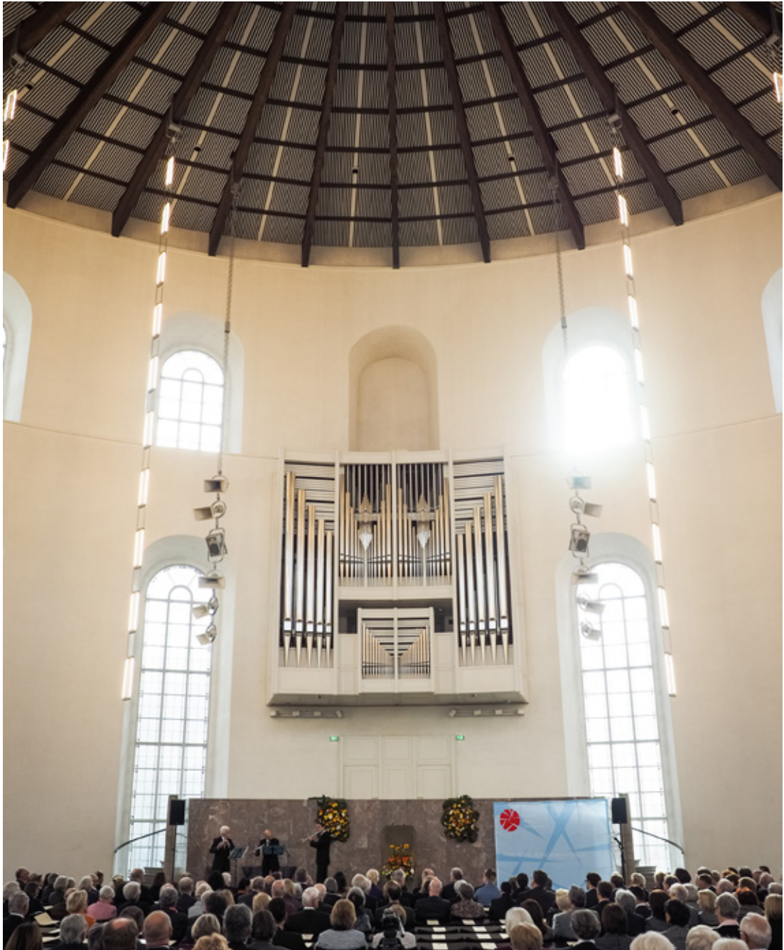
Die gut gefüllte Paulskirche.