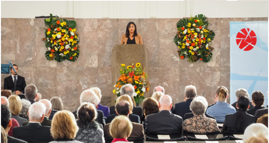
„Eine deutsche Jesidin aus Niedersachsen“ – Düzen Tekkal – während ihrer Laudatio auf Freya Klier.

Auch wenn die folgenden Verfassungen von den Fürsten oktroyiert wurden, mussten sie von nun an Gesetz und Recht folgen. Wann immer dieser Grundsatz in den nachfolgenden Jahrzehnten nicht eingehalten wurde, konnten sich diese Regime – sei es die Nazi-Diktatur oder die DDR-Diktatur – nicht dauerhaft etablieren.