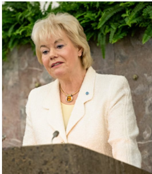
Erika Steinbach MdB, Vorsitzende der Stiftung ZENTRUM GEGEN VERTREIBUNGEN.