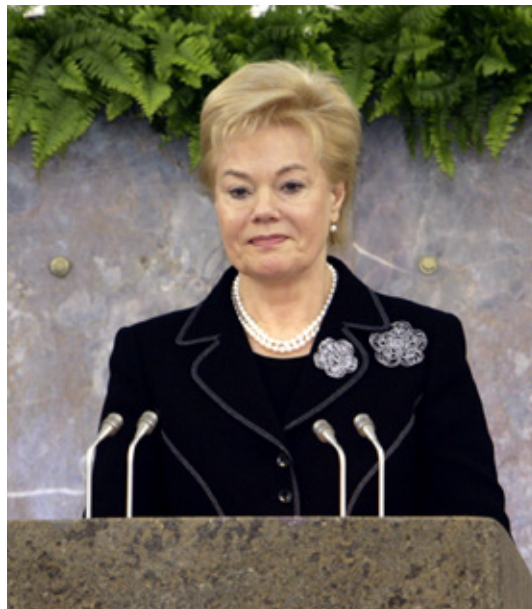
Erika Steinbach MdB, Vorsitzende der Stiftung ZENTRUM GEGEN VERTREIBUNGEN.

Mit der heutigen Preisverleihung ehren wir einen Mann, der durch sein Wirken maßgeblich zu einer offenen Vertreibungsdebatte in der Tschechischen Republik, seinem Heimatland, beigetragen hat. Die Jury hat einmütig entschieden, außerhalb unseres Zweijahresrhythmus, heute den Franz-Werfel-Menschen-