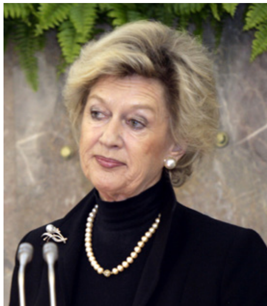
Petra Roth, Oberbürgermeisterin der Stadt Frankfurt am Main.

Und die, wie uns zuletzt an dieser Stelle vor wenigen Wochen bei der Diskussion um das Gedenken an den 9. November 1938 einmal mehr deutlich geworden ist, noch lange nicht