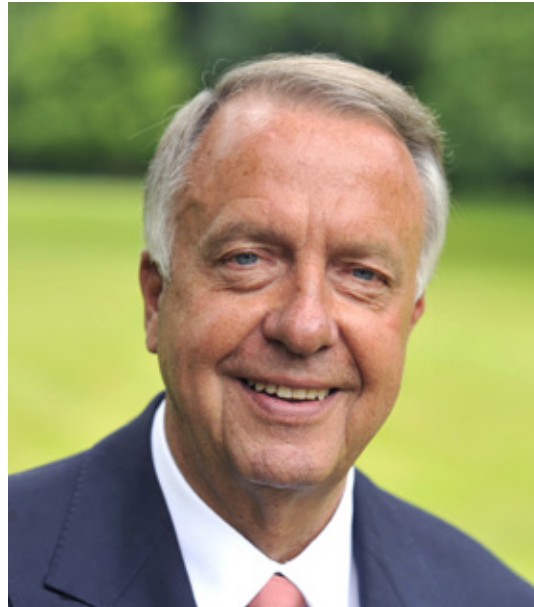
Der Beauftragte der Bundesregierung für Kultur und Medien, Staatsminister Bernd Neumann MdB.

Um bei dieser Aufgabe erfolgreich zu sein, bedarf es aber auch des bürgerschaftlichen Engagements, das dem Geist der „Charta der deutschen Heimatvertriebenen“ folgt, mit der bereits vor 60 Jahren ein überzeugendes Dokument der Versöhnung und Verständigung vorgelegt wurde. Deshalb bin ich besonders dankbar, dass die Stiftung ZENTRUM GEGEN VERTREIBUNGEN seit 2003 den Franz-Werfel-Menschenrechtspreis vergibt, der Einzelpersonen, Initiativen und Gruppen ehrt und fördert,