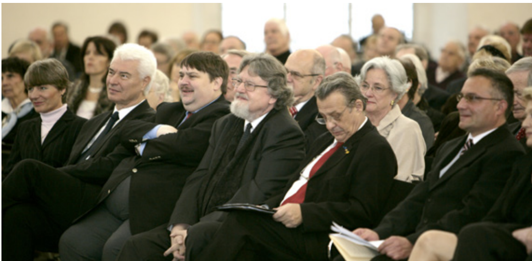
Gespannte Erwartungen in der ersten Reihe.