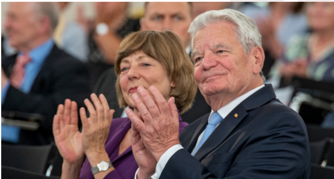
Daniela Schadt und Bundespräsident a.D. Dr. h.c. Joachim Gauck.