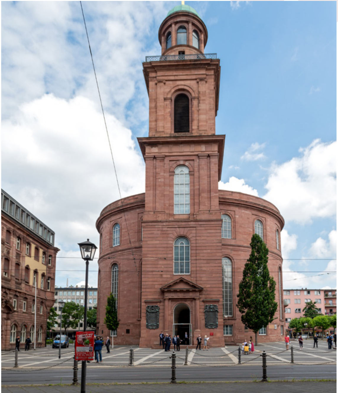
Seit 2003 der Ort der Preisverleihungen des Franz-Werfel-Menschenrechtspreises: Die Paulskirche in Frankfurt am Main.