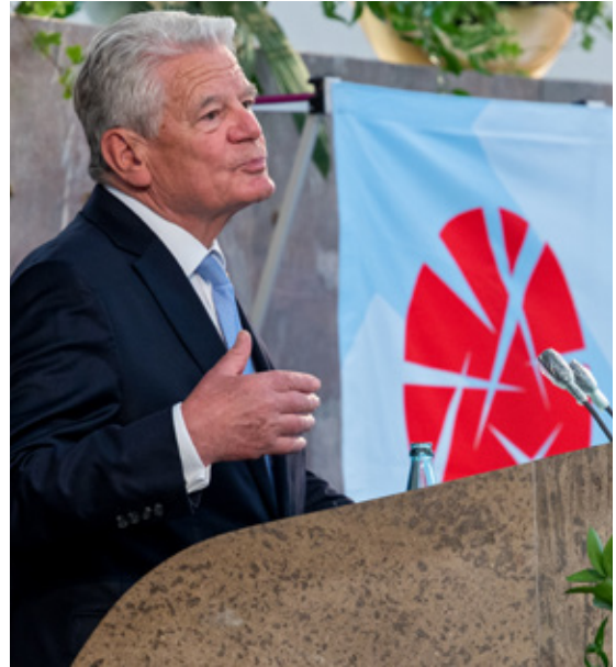
Bundespräsident a.D. Dr. h.c. Joachim Gauck während seiner Rede in der Paulskirche.