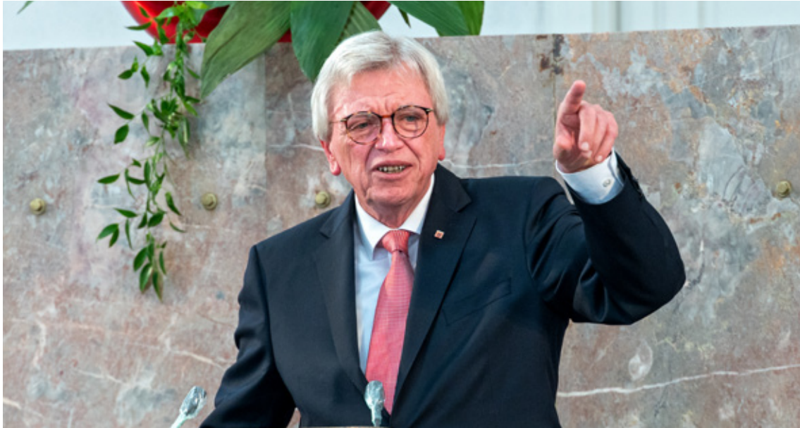
„Lieber Herr Bundespräsident, Sie sind ein Glücksfall für unser Land. Das hören Sie nicht gerne, ich sag es trotzdem“: Leidenschaftlicher Dank des Hessischen Ministerpräsidenten Volker Bouffier an Bundespräsident a.D. Dr. h.c. Joachim Gauck.