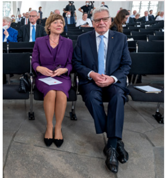
Bundespräsident a.D. Dr. h.c. Joachim Gauck und Daniela Schadt.

Flüchtlinge und Vertriebene, also Menschen, die ihres fundamentalen Rechts auf selbstbe-