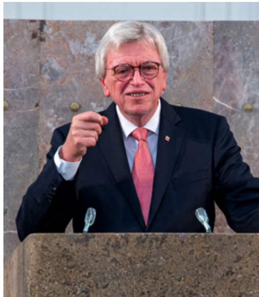
Schirmherr der Veranstaltung war der Hessische Ministerpräsi- dent Volker Bouffier.