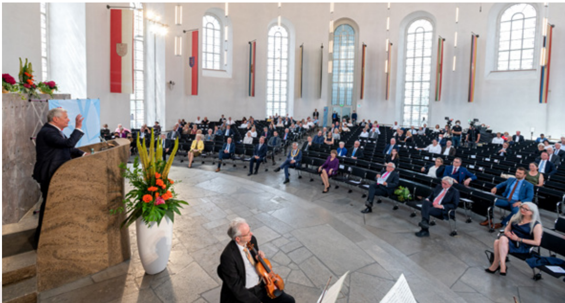
Durch die Corona-Pandemie bedingt waren die Plätze in der Paulskirche nur zur Hälfte besetzt.

Die Anerkennung und Dokumentation von Flucht und Vertreibung in Deutschland wäre aber unvollständig, wenn sie sich auf die Geschichte der alteingesessenen Deutschen beschränkte. Deutschland ist ein Einwanderungsland geworden. Neben uns wohnen und arbeiten Menschen, deren Fluchtgeschichten ihren Ausgangspunkt nicht im Sudetenland oder in Schlesien haben, sondern in Syrien, in der Türkei, im Irak, in Eritrea oder neuerdings auch in Venezuela. Integration darf nun keine Einbahnstraße sein, in einer pluralen Gesellschaft müssen die verschiedenen Fluchterfahrungen ihren Platz finden. Wir sind einander Interesse schuldig, weil wir Teile derselben Gesellschaft sind. Und was wäre geeigneter,