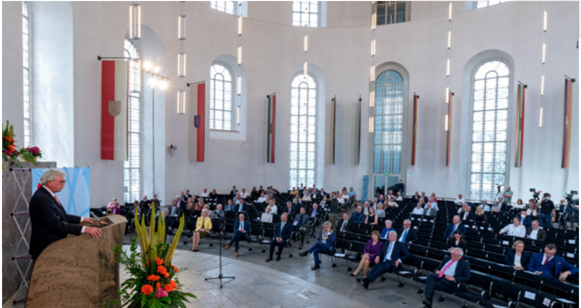
„Heimat ist ein Menschenrecht. Wer die Heimat erzwungenermaßen verliert, der verliert ein Stück Identität“: Hessens Ministerpräsident Volker Bouffier in der Paulskirche.

kunft möchte ich zu Ihnen, lieber Herr Dr. Gauck, sprechen. Wir leben in einer Zeit, in der die Welt vielleicht nicht friedlicher geworden ist, sicherlich unübersichtlicher und viele, viele Menschen auf der Flucht sind. Sie haben Ihr ganzes Leben, nicht nur als Bundespräsident, dieser großen, faszinierenden Aufgabe gewidmet, nicht nur für die Freiheit, sondern für die Menschenrechte unbeirrt und unerschrocken immer einzutreten. Nicht jedes Mal gab es Beifall, aber es war absolut richtig. Und deshalb ist es mir eine große Freude, dass die Jury Sie zum diesjährigen Preisträger gemacht hat und eine noch größere Freude, dass Sie diesen Preis entgegennehmen.